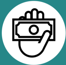
ПЛАТІЖ З ЕКОНОМІЇ ЕЛЕКТРОНОСІЇВ