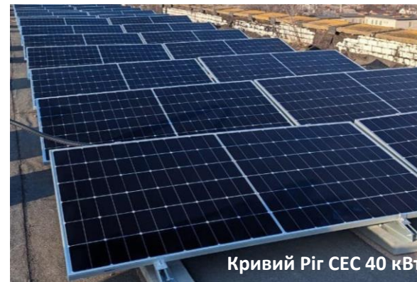
Кривий Ріг СЕС 40 кВт