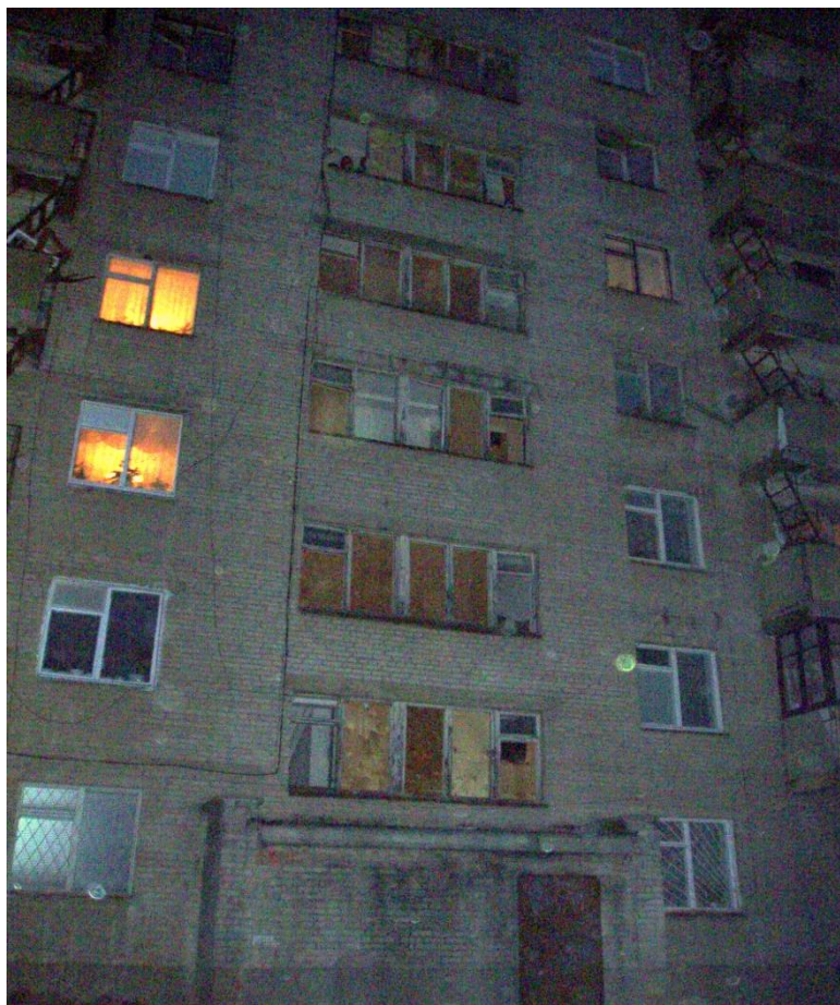
ФОТО ДО ПРОВЕДЕННЯ ЗАХОДІВ З ЕНЕРГОЗБЕРЕЖЕННЯ ТА ПІСЛЯ ЇХ ВПРОВАДЖЕННЯ