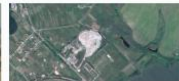
Карта розташування полігону ТПВ: 49.461603, 26.965095