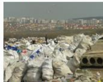
Полігон ТПВ, м. Хмельницький