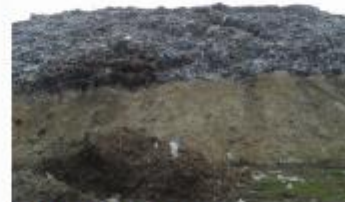
Полігон ТПВ, м. Хмельницький