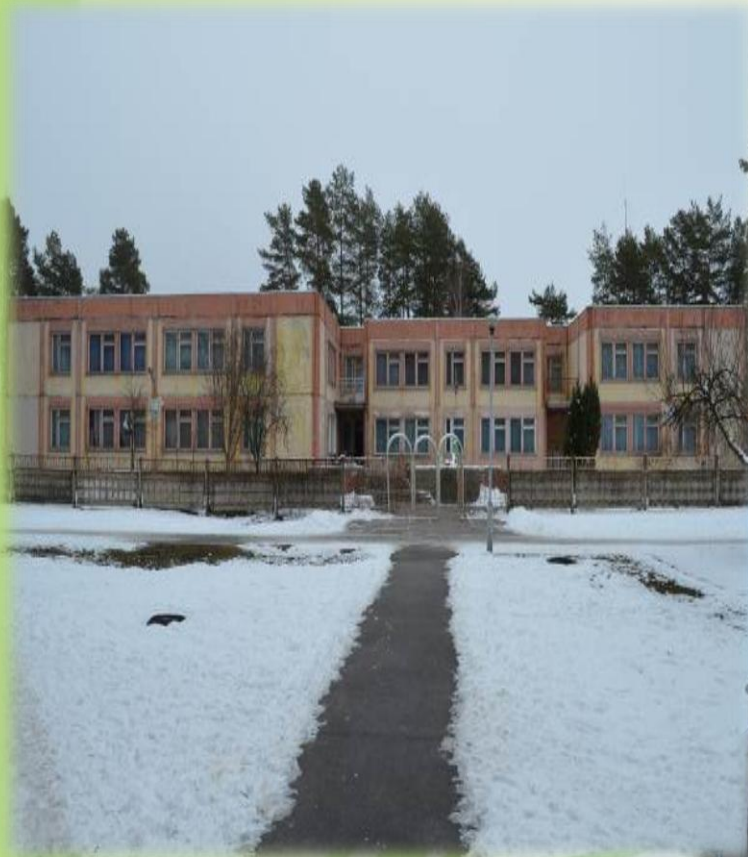
Дитячий садок "Калинка" ↗