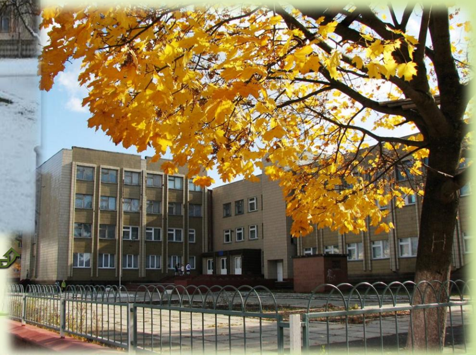
Школа №2 ↘