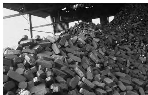
Таку якісну продукцію виготовляє Маневицький торфобрикетний завод.

Микола ЯКИМЕНКО. Волинська область.