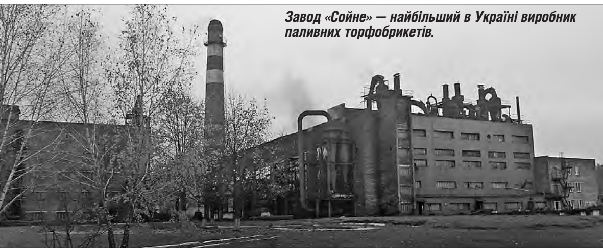
Завод «Сойне» — найбільший в Україні виробник паливних торфобрикетів.

До речі, з проханням не включати підприємство до переліку об'єктів приватизації керівництво області і депутати зверталися до уряду ще в 2019-му та 2020 році, коли цей список лише формувався. Спроби приватизувати «Волиньторф» траплялися і раніше. Це викликало протести в колективі, який хоче працювати стабільно і не переживати за перспективу. Варто зважити й на те, що обидва заводи підприємства