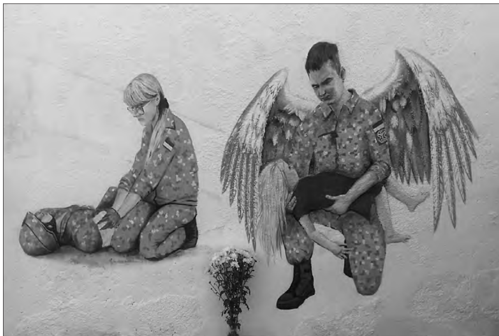
До янгола в камуфляжі вже несуть квіти.

Творчий задум, безумовно, цікавий та багатогранний. Але перехожі найчастіше зупиняються у задумі все ж саме біля янгола у камуфляжі. До нього навіть бу-