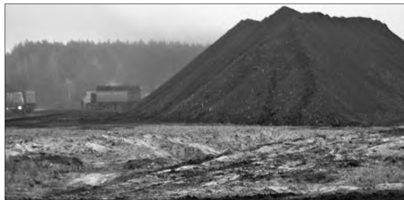
Кагати, із заготовленою для переробки торфокрихтою нагадують терикони шахт. Недарма дехто називає торфобрикетні заводи шахтами під відкритим небом.

Нагадаємо, кілька днів тому начальник Волинської ОВА