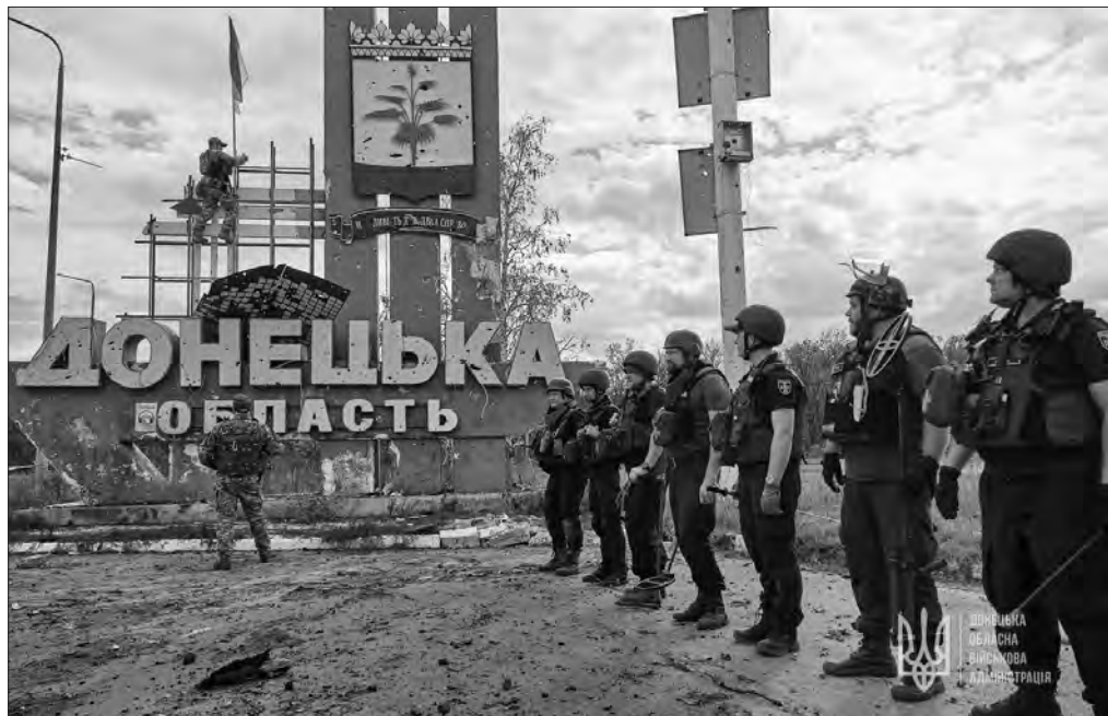
Під час відвідання деокупованої ділянки траси Київ — Харків — Довжанський на межі Донецької і Харківської областей.

Над номером працювали: Владислав ЛЕОШКО, Тетяна УВЕРОВА.